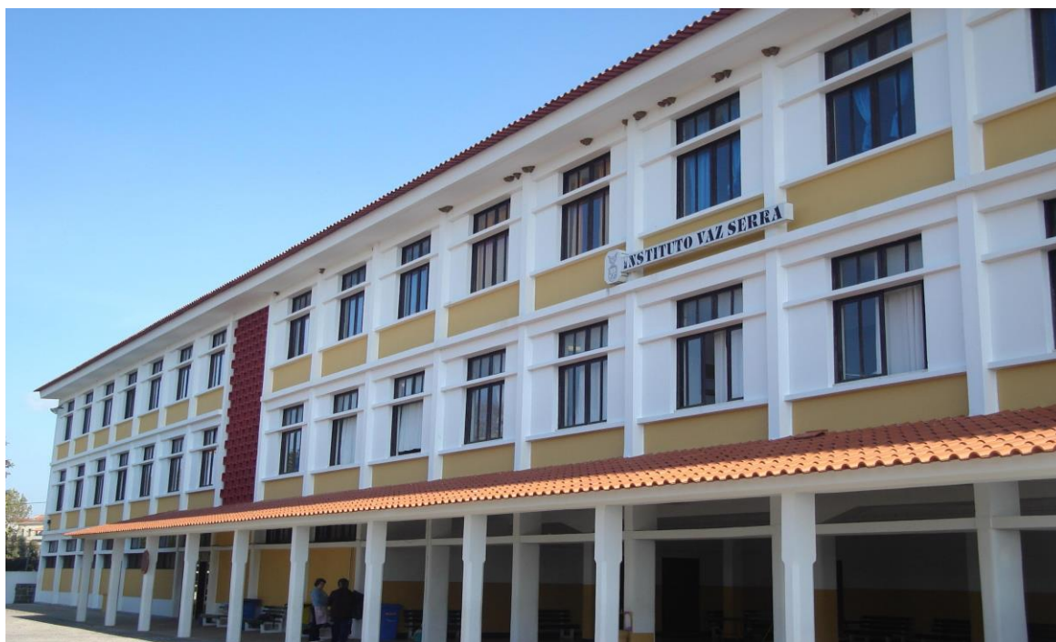
Instituto Vaz Serra